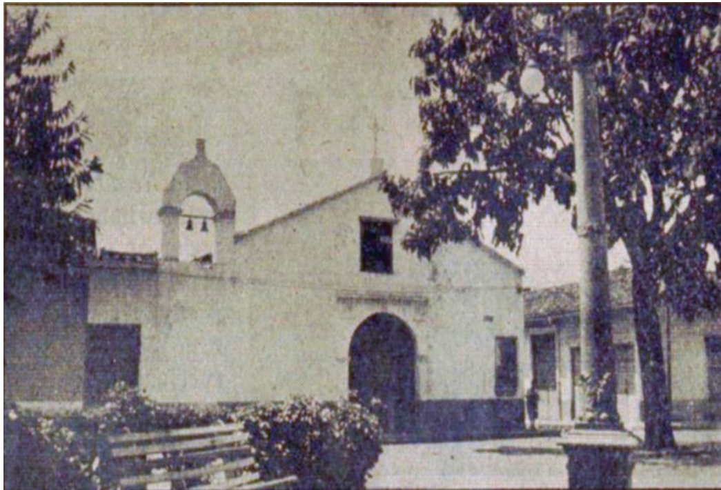
Imagen 1. Foto de la capilla de Nuestra Señora de los Dolores con una sola torre